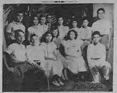
Grupo de graduados que recibieron su certificado de conclusión de estudios primarios Escuela Tobías Guzmán Brenes. San Mateo