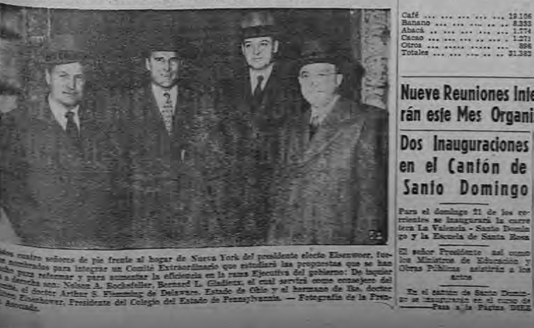
Estos cuatro señores de pie están al lugar de Nueva York del presidente electo Eisenhower...