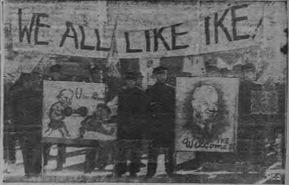
Estudiantes uniformados muestran algunos de los carteles en Seúl que el Presidente electo Eisenhower verá al llegar a la capital del sur de Corea...